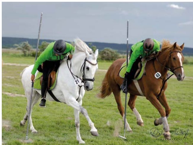
Gemeinschaft: Half Section Lance in höchster Synchronität

Die siebte Prüfung ist Indian File. Hierbei handelt es sich um eine reine Team Disziplin. Hierfür werden vier Pegs auf einer Bahn hintereinander aufgereiht. Ziel der vier Reiter ist es, die Pegs der Reihe nach aufzunehmen. In diesem Wettkampf werden die im ersten Durchgang mit der Lanze erlangten Punkte zu denen im zweiten Lauf mittels Säbel gezogenen Pegs addiert.