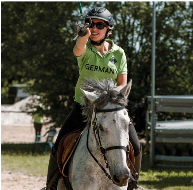
Präzision: millimetergenaues Zielen bei Ring Ring Peg

Die diesjährigen Meisterschaften umfassen insgesamt neun verschiedene Disziplinen. Die ersten sechs Disziplinen – mit Lanze und Säbel – können jeweils einzeln, als Paar oder als Team absolviert werden. Diese Disziplinen werden auf einer Strecke von ca. 100 Metern ausgetragen mit vier parallel nebeneinander liegenden Bahnen. Zu Beginn des Durchgangs muss der Reiter das Pferd angaloppieren und versuchen, den bei ca. 70 Metern gesteckten Peg zu treffen. Idealerweise schafft der Reiter es, den Peg mit seiner Waffe aufzunehmen und zehn Meter weit über die Ziellinie (Carryline) zu transportieren. Gelingt dem Reiter dies, erhält er sechs Punkte. Nimmt der Reiter den Peg auf, verliert diesen jedoch vor der Carryline (Draw), erhält er vier Punkte. Wird der Peg durch die Waffe markiert, verbleibt allerdings in seiner Position, so erhält der Reiter zwei Punkte (Strike). Werden die Disziplinen als Team absolviert, ist zusätzlich die Synchronität der Reiter von Bedeutung. Auch die Zeit, die für den Run benötigt wird, fließt in die Punktvergabe ein.