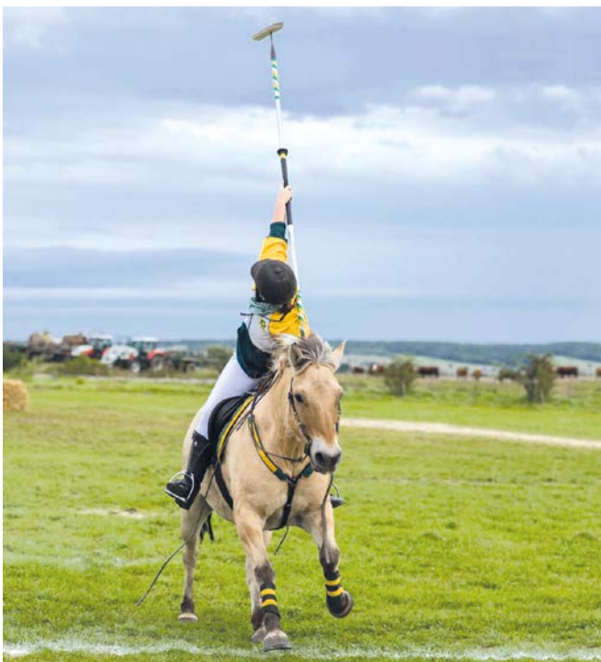
Körperbeherrschung: vollkommene Einheit von Pferd und Reiter bei Individual Lance