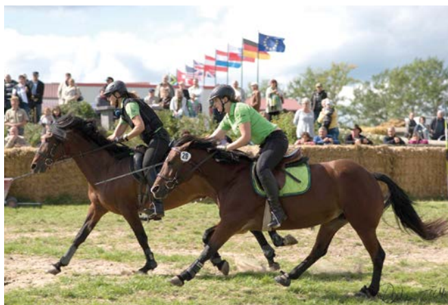
Geschwindigkeit: Half Section Sword im gestreckten Galopp

Dieses Jahr finden in Crawinkel die 3. Deutschen Internationalen Meisterschaften im Tent Pegging statt. Parallel zu diesem Turnier werden auch internationale Wettkämpfe des Kavallerieverbandes ausgetragen, die „Tage der Kavallerie 2018“. Hierzu kamen in der Vergangenheit unter anderem Mannschaften aus der Schweiz, Großbritannien, Polen und Ungarn sowie Reiter aus den USA, den Niederlanden und weiteren Nationen